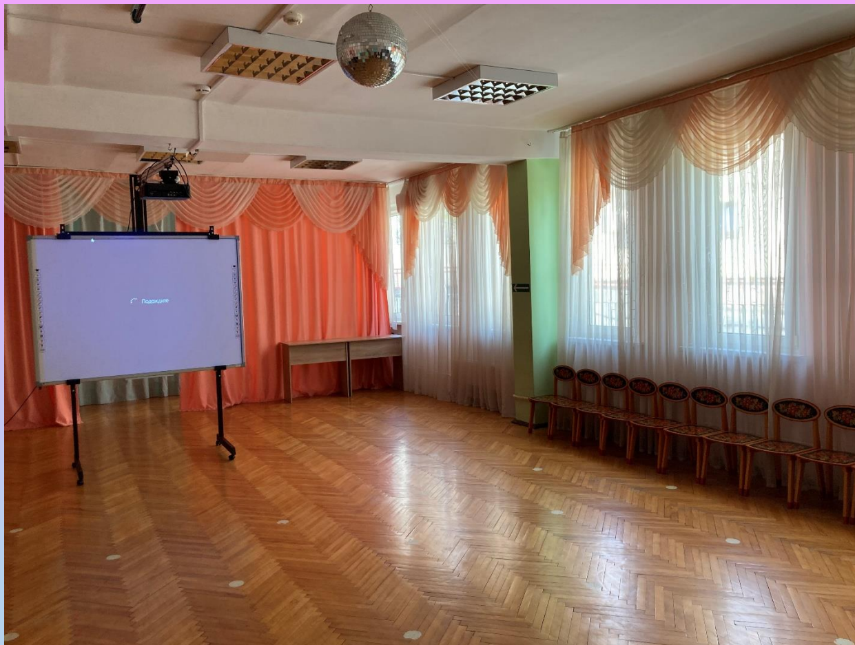
Актный зал, апрель 2024 года